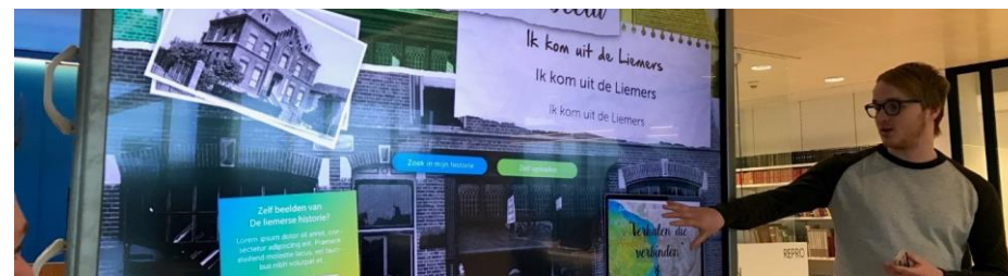
Figuur 4: Studenten van de HAN maakten een prototype voor de Liemerse Beeldbank

De historische verenigingen gaan foto's en collectiestukken die het verhaal van de Liemers vertellen online toegankelijk maken in één website, een zogenaamde Liemerse Beeldbank. Kunstwerk! Liemers Museum en het Streekarchivariaat Liemers & Doesburg worden hierbij betrokken, waar het gaat om kennis en ervaring. Bij het digitaliseringsproces zijn daarnaast veel helpende handen nodig. Daarom worden inwoners en organisaties uit de Liemers nauw betrokken bij het digitaliseren van de foto's. Een mogelijke samenwerkingspartner hierbij is de Regionale Sociale Dienst (RSD) De Liemers. De Beeldbank kan werkzoekenden helpen bij re-integratie op de arbeidsmarkt door het bieden van een maatschappelijk relevante werkervaringsplaats. Daarnaast wordt er een verbinding gelegd met lokale foto- en filmclubs in de Liemers.