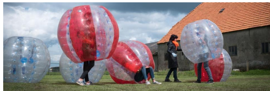
Figuur 13: Eén van de activiteiten die Leven in de Liemers in de vorige periode mogelijk maakte

Ook in deze Cultuur- en Erfgoedpact periode maken de samenwerkende gemeentes weer financiële ruimte voor (kleinere) lokale initiatieven die voldoen aan de criteria van het pact: cultuureducatie, cultuurparticipatie en/of cultuurtoerisme. De te organiseren activiteit moet aansluiten op de rode draad van het Cultuur- en Erfgoedpact: Leven in de Liemers: leven, beleven en beleefbaar maken!