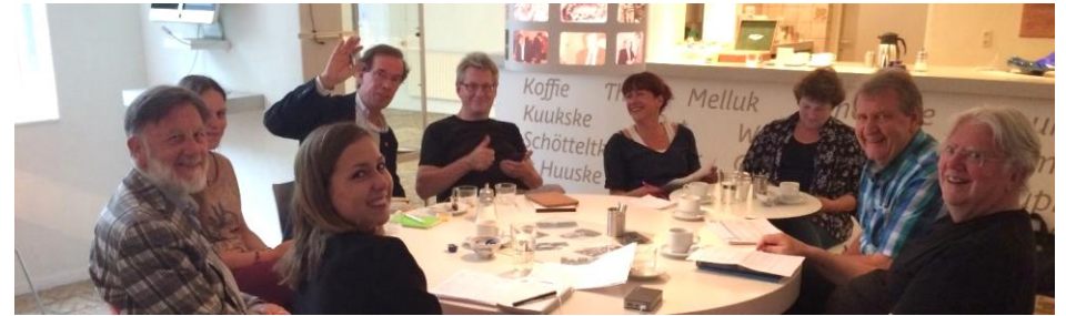
Figuur 1: De schrijversavonden met de canonauteurs waren een van de vele momenten waarop waardevolle verbanden zijn gelegd

In de vorige Cultuur- en Erfgoedpact periode (2013-2016) is er een sterk netwerk opgebouwd van cultuur- en erfgoedorganisaties, professionals en vrijwilligers uit de regio. De projecten en haar culturele activiteiten creëerden meer betrokkenheid onder inwoners van de Liemers en meer bekendheid met het verhaal van de Liemers. Het oral history project dat werkte met vrijwilligers uit de regio en waarbij persoonlijke verhalen werden opgehaald is daar een mooi voorbeeld van.