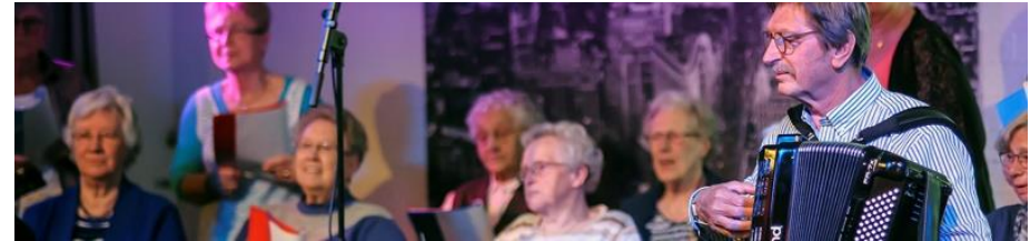
Figuur 10: Eindeloos musiceren, optreden met ouderen

Geïnspireerd door de succesvolle pilot 'Eindeloos Musiceren' van Kunstwerk! Musiater en welzijnsorganisatie Welcom wordt het komende Cultuur- en Erfgoedpact een muzikale dagbesteding ontwikkeld voor kwetsbare doelgroepen in de hele Liemers. Allerlei doelgroepen (waaronder vluchtelingen, ouderen, jongeren met een beperking) staan in dit project zelf op de planken. Brede welzijnsorganisaties Caleidoz en Mikado zijn belangrijke samenwerkingspartners binnen het project.