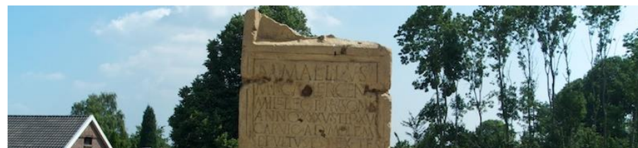
Figuur 12: Grafsteen Marcus Mallius bij Carvium ad Molem op de Herwense dijk

Dit project heeft als doel verborgen verhalen in het landschap weer tot leven te wekken met behulp van creatieve en innovatieve techniek. Een goed voorbeeld hiervan is het verdronken dorp Leuffen in de gemeente Duiven of de resten van de Romeinse forten (Romeinse Limes) die onder water in het recreatiegebied de Byland aanwezig zijn. Ook de geschiedenis en invloed van het water in de Liemers kan op deze manier inzichtelijk gemaakt worden. Dijkdoorbraken en veranderende waterlopen hebben immers een grote invloed gehad in de Liemers. Veel van deze historie ligt langs bestaande of verdwenen routes in het landschap.