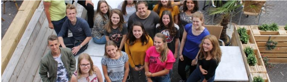
Figuur 6: Jongeren van Candea College en Liemers College vormen de redactie van de DLHG Courant

In de krant komt een culturele agenda met activiteiten op het gebied van kunst, cultuur en erfgoed. De artikelen van de papieren uitgave worden ook online gepubliceerd en via sociale media verspreid om het bereik zo groot mogelijk te maken.