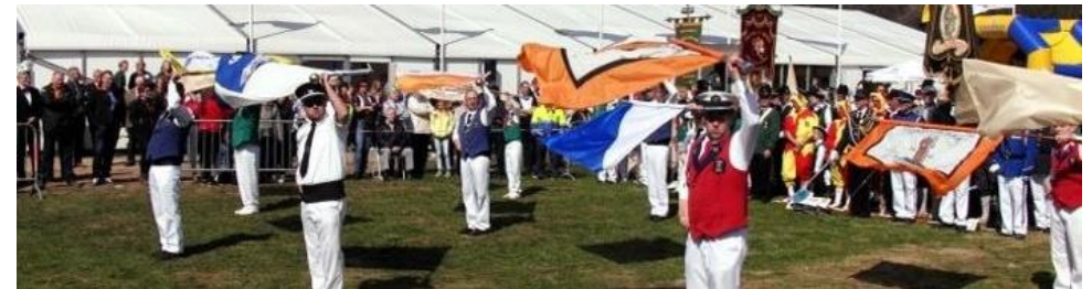
Figuur 7: Landjuweel te Oud-Dijk, juni 2017, een groot succes

Het lespakket leert scholieren van groep 5 tot 8 over de waarde van de Liemerse tradities. Onderwerpen die aan bod komen zijn: schutters, carnaval, vendelzwaaien, religie en streektaal. De leerlingen gaan zelf actief aan de slag, waardoor de tradities tot leven komen en levend blijven. Op Fort Geldersoord te Westervoort wordt een slotmanifestatie georganiseerd met lokale verenigingen, toegankelijk voor alle inwoners van de Liemers.