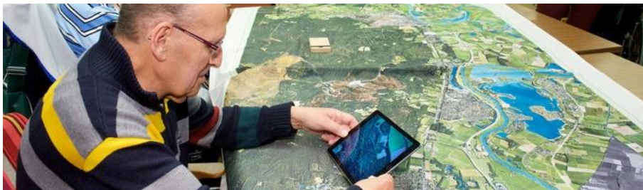
Figuur 5: Innovatieve techniek (Augmented Reality) helpt bij herinneren en verhalen ophalen

Door gebruik te maken van reeds ontwikkelde techniek van CollectieGelderland.nl (een project van Erfgoed Gelderland) kan de Liemerse Beeldbank duurzaam en efficiënt ontwikkeld worden. De Beeldbank vormt een bron van inspiratie voor allerlei projecten. Het verzamelde materiaal kan daarnaast door alle deelnemers aan het Cultuur- en Erfgoedpact worden gebruikt.