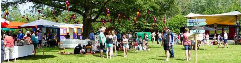
Figuur 9: Buitenblik jaarlijks festival aan de Breuly

De Kunst van het maken daagt festivals in de Liemers uit om te innoveren en nieuwe doelgroepen aan te boren. In samenwerking met het Liemerse Voortgezet Onderwijs en de combinatiefunctionarissen wordt verder uitgewerkt op welke manier jongeren en scholieren betrokken kunnen worden bij het invullen en innoveren van festivals in de Liemers. Te denken valt aan een inspiratieplein waarbij jongeren experimenteren met nieuwe media.