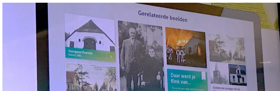
Figuur 2: Prototype van de Liemerse Beeldbank

Het verhaal van de Liemers is niet compleet zonder beeld. In 2016 is een aanzet gegeven tot een Liemerse Beeldbank. In samenwerking met het innovatieve project GelderLab van de Provincie Gelderland maakten studenten van de afdeling Communicatie Multimediadesign van de Hogeschool Arnhem Nijmegen (HAN) een prototype voor deze Beeldbank. Het idee van de Beeldbank is alle historische fotocollecties van de Liemers zichtbaar, bruikbaar en beleefbaar te maken voor iedereen. De beeldbank fungeert op zijn beurt weer als belangrijke bron voor activiteiten en cultuur- en erfgoedprojecten van het pact in de Liemers.