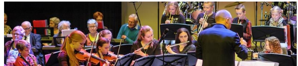
Figuur 11: Liemers Jeugdorkest bij Eindeloos musiceren

Deelnemers aan de dagbesteding werken onder begeleiding van professionele muziekdocenten, tekstschrijvers en componisten aan hun muzikale en culturele vaardigheden. Denk hierbij aan zingen, muziek maken, spelvormen en bewegen. Waar mogelijk worden lokale muziekverenigingen, Liemers Jeugdorkest en het Liemers Jeugdkoor betrokken. Tijdens de dagbesteding wordt er waar mogelijk kennis gemaakt met popcultuur, zoals rap. Gezamenlijk werken we toe naar een aantal eindvoorstellingen in de Cultuur- en Erfgoedpact periode, met als thema Leven in de Liemers.